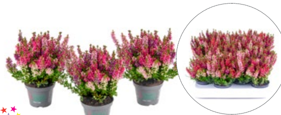
6,5er Wildberry Wonder