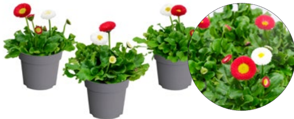
10,5er Twin rot-weiß