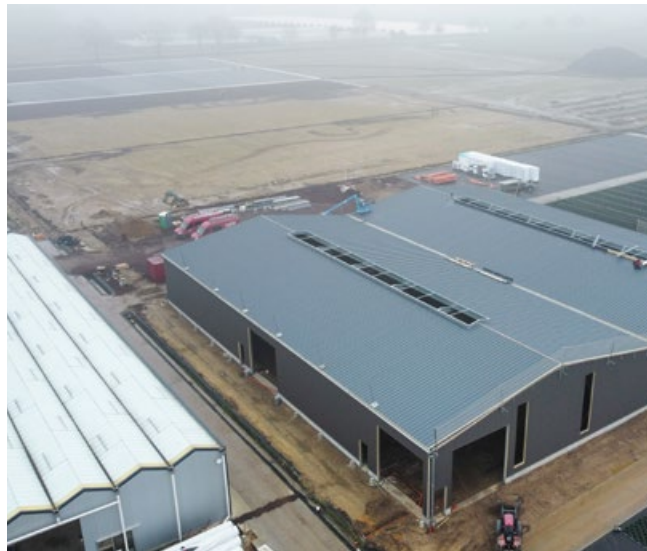
2000m 2 große Topf- und Versandhalle