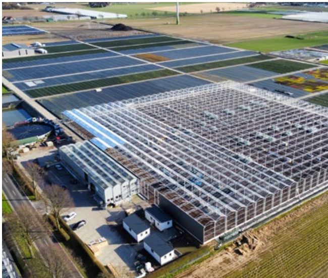
1,6 ha Gewächshaus

Das gesamte Projekt wurde von Juli 2021 bis Juli 2022 umgesetzt.