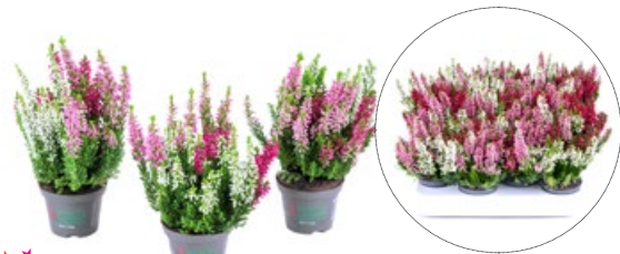
6,5er Milca White