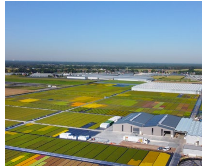
7 ha zusätzliche Produktionsfläche